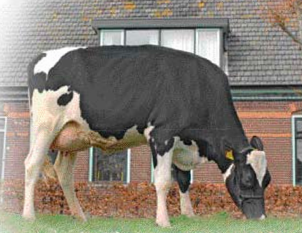
Future Dreams Holstein Sonja 134 (v. Goldwyn), 88 punten Voorspelde productie: 2.01 305 9317 4,03 3,31 lw 114

Inmiddels staat er sinds vijf jaar een nieuwe ligboxenstal met plaats voor 52 koeien en sinds enkele weken is ook het jongvee in een hagelnieuwe stal gehuisvest. 'Het jongvee zit tot een half jaar oud op volledig stro. Daarna verblijft het, net als de droge koeien, in grote hokken met langs de voergang roosters en daarachter grote stroruimten. Jongveeopfok kost geld, dus moet je het wel zo goed mogelijk doen. We streven naar ruim ontwikkelde dieren die op 2.00 jaar afkalven. Dit huisvestingssysteem kan volgens ons aan de ontwikkeling naar